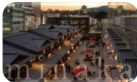
インバウンド客にも喜ばれる外観

江戸時代の小田原城にあった宿場町の心を今に再現することをテーマに令和2年12月に開業し、「小田原新城下町」と、地上14階建てのタワー棟を擁する複合商業施設。小田原・西湘エリアのローカルフード・飲食を中心にした全48店を展開する。タワー棟には官公庁や市立図書館、クリニック等も入り、地域の活性化と地方創生につながっている。