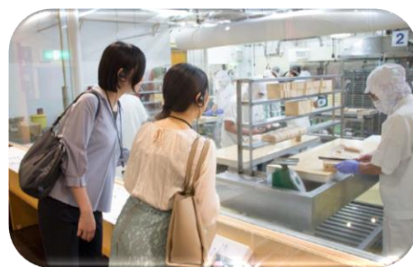
職人の技を間近で見学できる

鈴廣が江戸の頃より作り続ける伝統のかまぼこ。和の食文化の深みを、観て、触れて、味わってもらいたいという想いの詰まった「鈴廣かまぼこの里」のガイドツアー。国の登録文化財に指定されている母屋と土蔵の建物の魅力やかまぼこの歴史・作り方・栄養のこと等、かまぼこソムリエが案内する。（小田原蒲鉾協同組合所属）