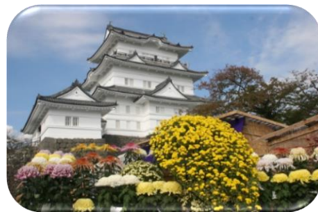
訪問日には菊花展が開催中

小田原城は関東を五代にわたって支配した北条氏の本拠地である。戦国時代、「越後の龍」上杉謙信、「甲斐の虎」武田信玄という戦上手の攻撃をしのぎ、豊臣秀吉による天下統一の最後に破られるまで続いた「難攻不落の城」である。現代に復興された城址公園では、要害堅固の登城ルートを歩くガイドツアーが人気となっている。